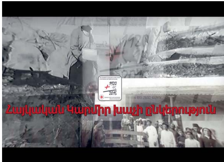
Video clip dedicated to the ARCS 95th Anniversary was made